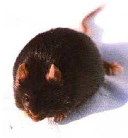
Diese durch eine natürliche Veränderung eines Gens (Mutation) entstandene «Fettmaus» wird in der Forschung eingesetzt. Sie wird mit zunehmendem Alter so dick, dass der Tierpfleger oder die Tierpflegerin sie wenden muss, wenn sie zufällig auf den Rücken fällt.