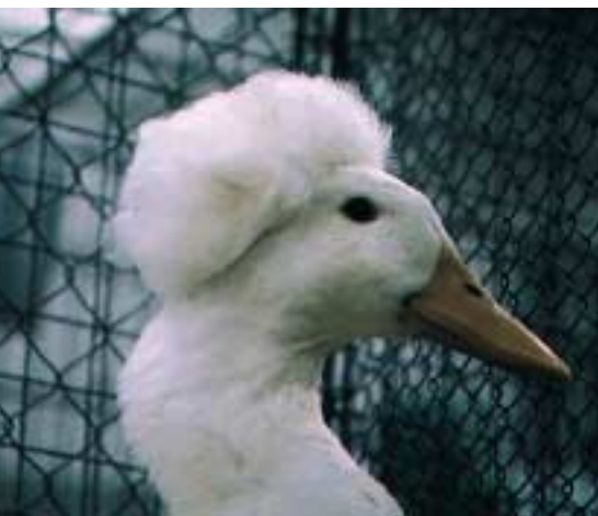
Haubenenten haben z.T. grosse Löcher in der Schädeldecke, und das Hirn ist verformt. Dies ist auf Fetteinlagerungen im Schädelinneren zurückzuführen. Diese Veränderungen verursachen bei den Enten Gleichgewichtsstörungen. Für die hohen Brutverluste bei dieser Rasse sind u.a. grossflächige Hirnbrüche verantwortlich, die zusammen mit Schnabelmissbildungen kurz vor dem Schlupftermin zum Absterben der Küken führen.

Gesetz, die sich auf die Weiterzucht, Haltung und Verwendung von gentechnisch veränderten Tieren bezieht. Die Güterabwägung auf dieser zweiten Stufe, im wesentlichen eine vertiefte Güterabwägung der ersten Stufe für die Herstellung, muss gleichermassen für gentechnisch veränderte Tiere und Tiere aus herkömmlicher Zucht durchgeführt werden. Die Begründung liegt darin, dass nicht nur die gentechnische Herstellung ein Tier beeinträchtigen kann. Auch Tiere, die mit traditionellen Verfahren gezüchtet oder in nicht-gentechnischen Verfahren hergestellt wurden, können Belastungen ausgesetzt oder anderweitig in ihrer Würde verletzt sein. Man denke beispielsweise an Extremzüchtungen. EKAH und EKTU vertreten deshalb einstimmig die Auffassung, dass gentechnisch veränderte, mit herkömmlichen Methoden oder durch herkömmliche Paarung gezüchtete Tiere hinsichtlich Zucht, Haltung und Verwendung rechtlich gleichgestellt sein müssen.