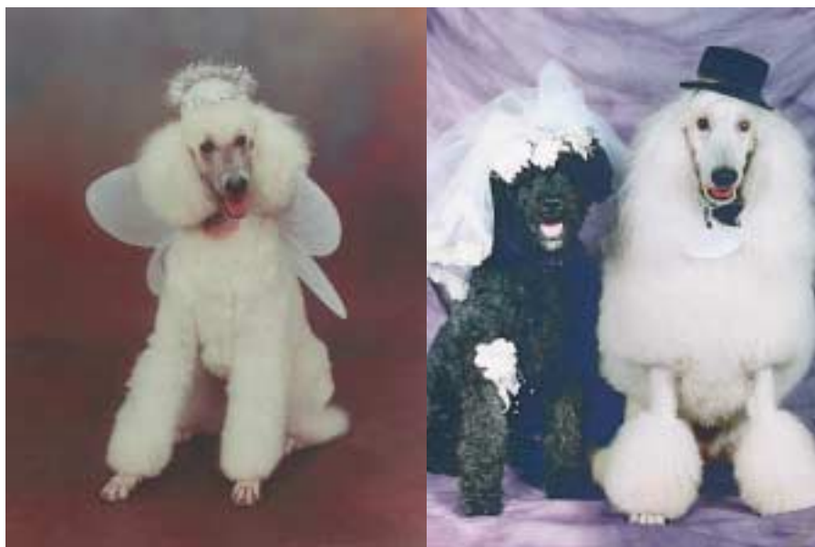
Lustig oder entwürdigend?