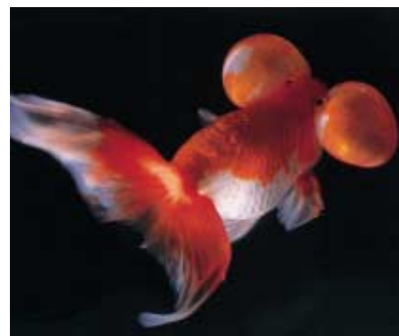
Bei der hochgezüchteten Goldfischrasse «Blasenaugen» sind die Augen vergrössert und nach oben gedreht. Darunter liegen dünnhäutige, mit Flüssigkeit ausgefüllte Ausstülpungen bis maximal Taubeneigrösse. Die Sicht der Tiere ist wesentlich eingeschränkt.

In den wenigsten Fällen liegt eine einheitliche Interessengewichtung und damit ein zwingend sich ergebendes Resultat der Güterabwägung vor. In beiden Kommissionen besteht jedoch Einstimmigkeit hinsichtlich eines generellen Verbotes der Herstellung von gentechnisch veränderten Heim-, Hobby- und Sporttieren sowie von Tieren allein zur Steigerung der Produktion von Lu-